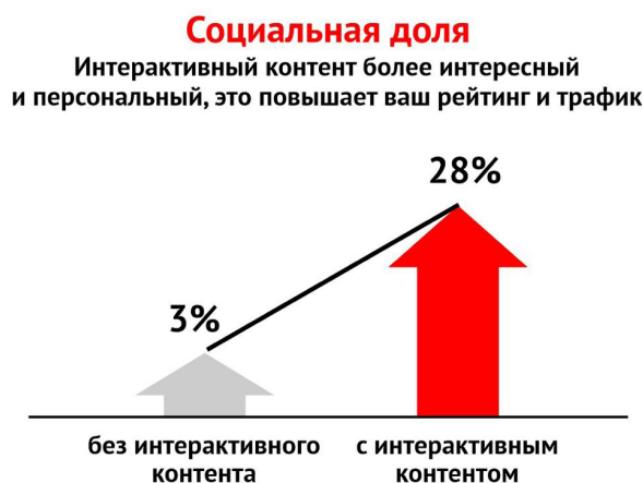
Рис. 1. Рост трафика при использовании интерактивности

Результаты ежегодного исследования Digital 2022 Global Overview Report показали, что типичный пользователь YouTube проводит в мобильном приложении 23,7 часа в месяц [5]. По данным исследования DemandGen аудитория интересуется интерактивным контентом вдвое больше, чем текстом одновекторной направленности [6]. При этом 69% респондентов предпочитают файлы в формате GIF, 65% выбирает видео, а 82% привлекает интерактивность в любой форме. А аудитория Facebook 1 проводит за просмотром Live-видео в четыре раза больше времени [7], чем за просмотром записанных заранее роликов. Интересным и увлекательным контентом пользователи делятся на 28% [8] чаще, чем статическим [9] (см. рис. № 1). Благодаря использованию технологий интерактивности значительно увеличивается охват аудитории и растет рейтинг издания.