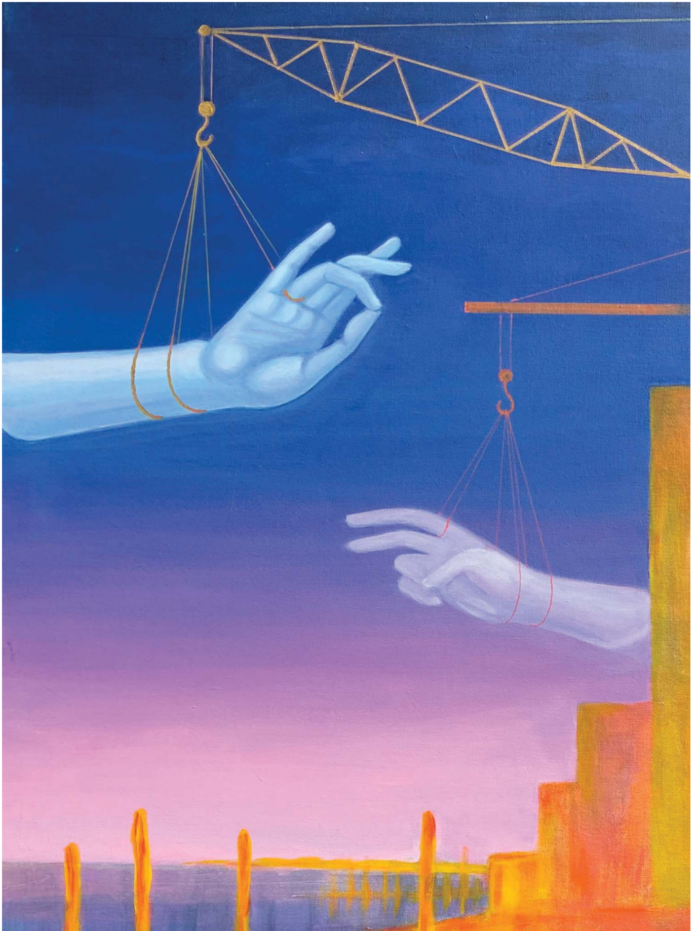
Фрагмент картины Алины Костриченко