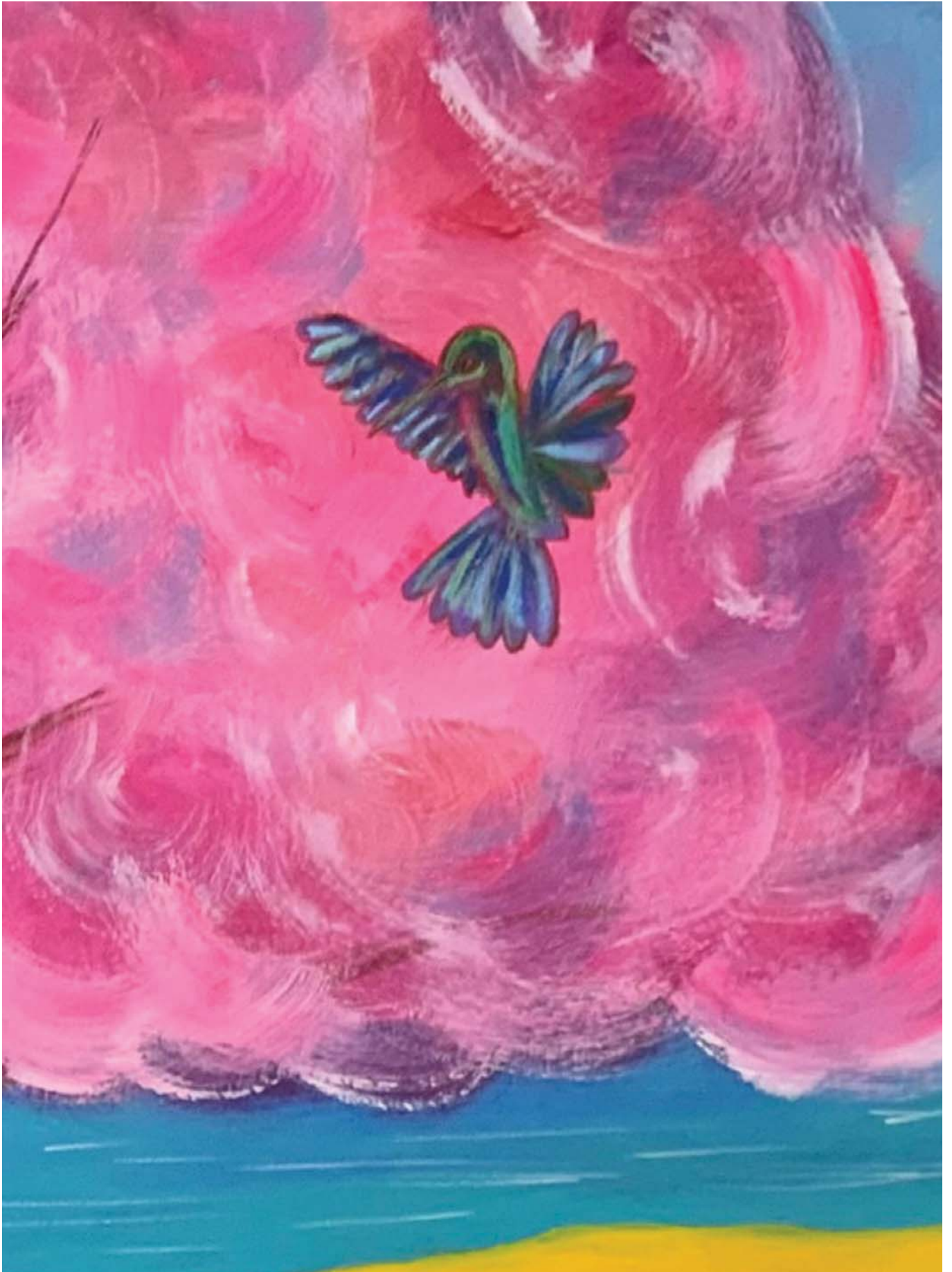
Фрагмент картины Алины Костриченко