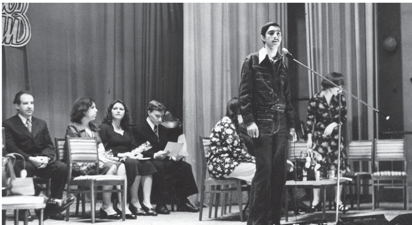
День поэзии 1977 г.