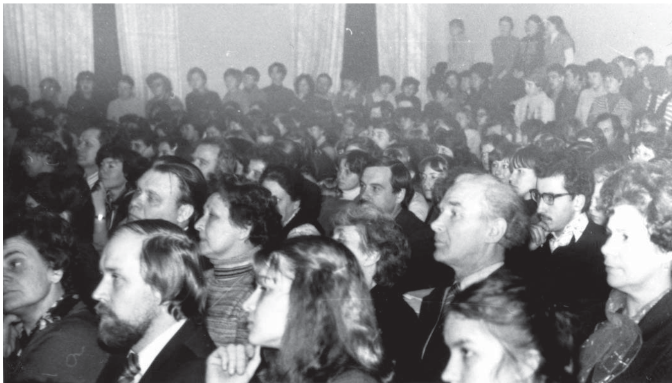
День поэзии ВГУ 1980 г.

Всем участникам Дня поэзии ВГУ – весны, творчества и любви!