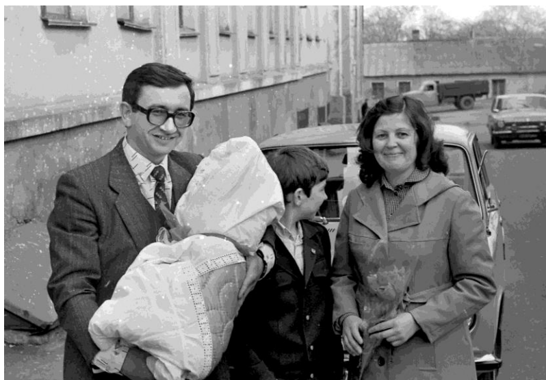
Вот оно, счастье...