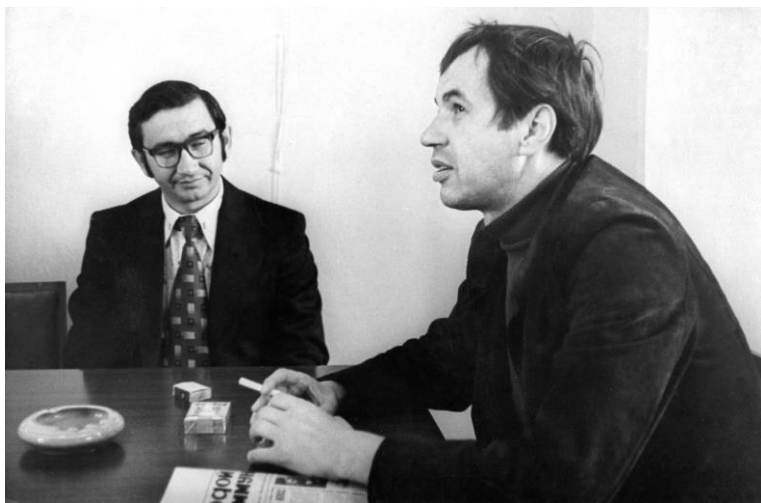
С Заслуженным артистом РСФСР Г.И. Бурковым.