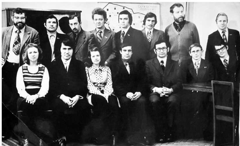
Редакция «Молодого коммунара». Конец 1970-х.