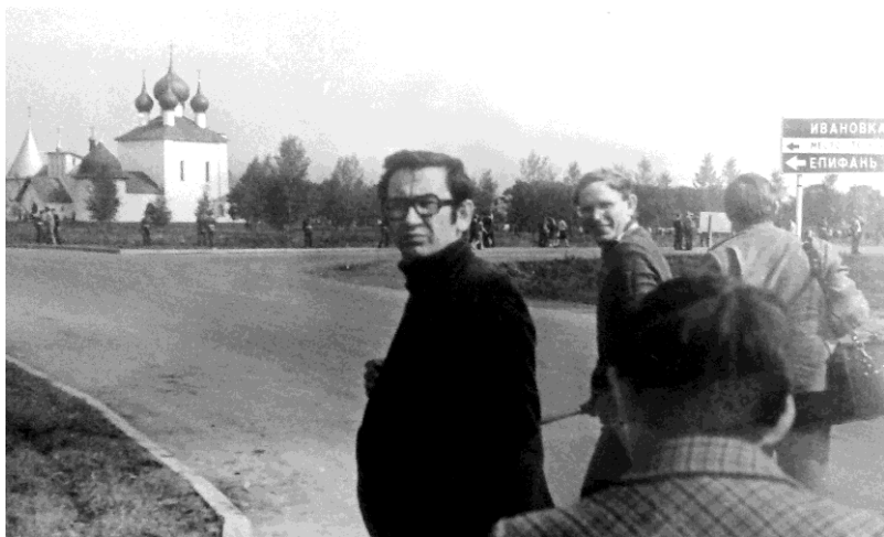
На Поле Куликовом в день 600-летия знаменитого сражения русских войск с Золотой Ордой. 8 сентября 1980 года.