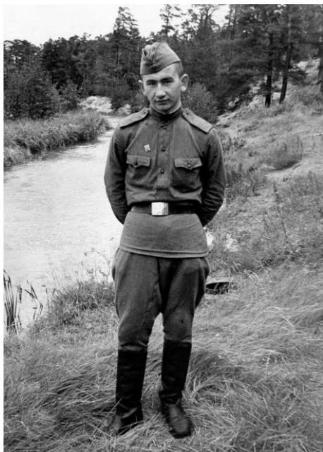
Служба в армии.