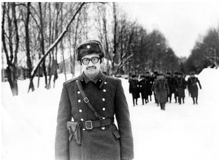
На офицерских курсах «Выстрел».