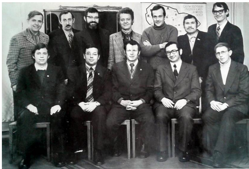
Редакция «Молодого коммунара». Середина 1970-х.