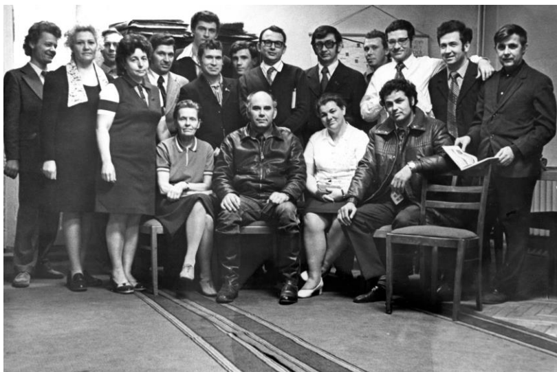
Встреча с писателем и журналистом, лауреатом Ленинской премии В.М. Песковым в «Молодом коммунаре». Конец 1970-х.