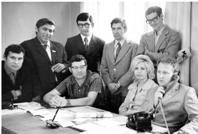
Редакция «Молодого коммунара». Середина 1970-х.