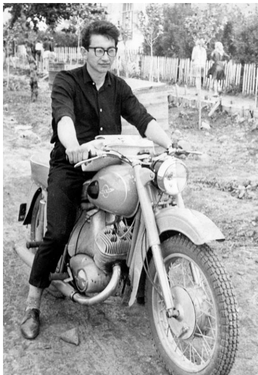
На улице родного Эртиля. Середина 1960-х.