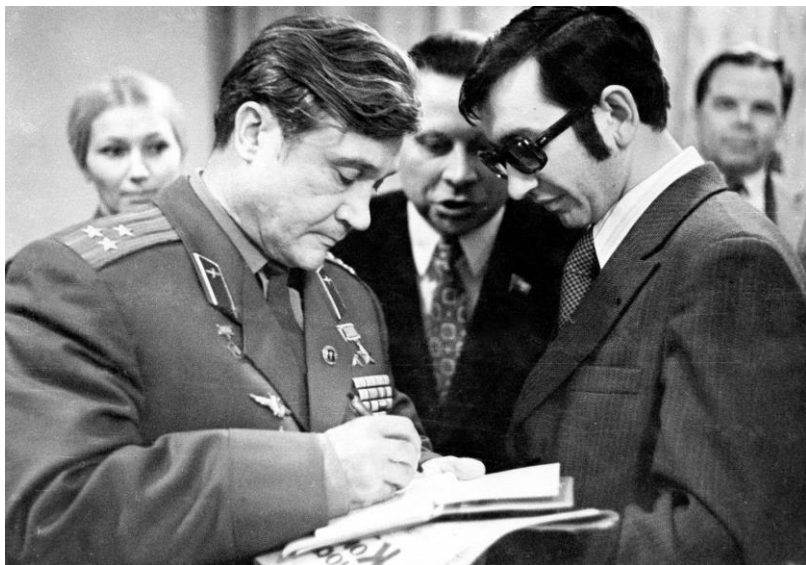
С дважды Героем Советского Союза, лётчиком-космонавтом СССР и земляком А.В. Филипченко и первым секретарём Воронежского обкома КПСС В.Н. Игнатовым.